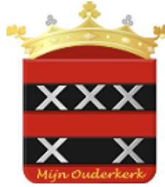
Stichting Vrienden van Ouderkerk Erfgoed en groen met elkaar wat aan doen